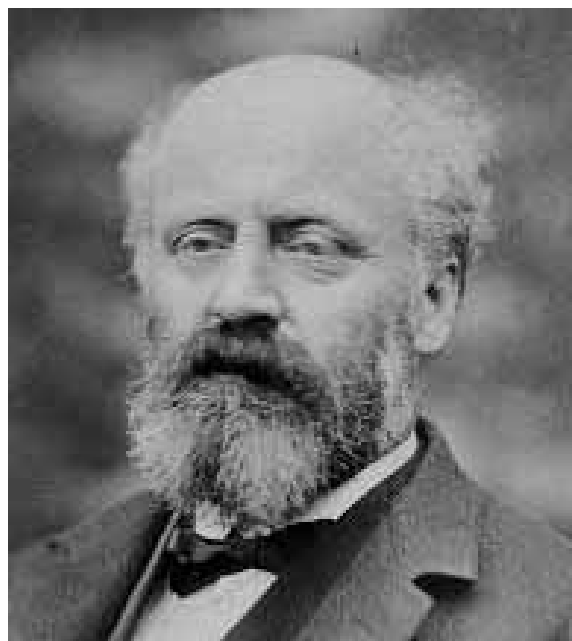
Fig. 8. James Wimshurst (1832-1903).